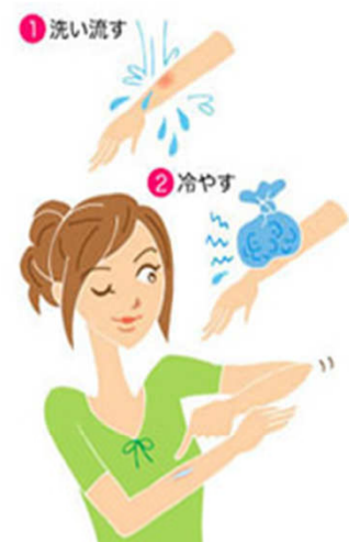
できるだけ、掻かないようにしましょう！

虫刺されは、とても日常的な皮膚病のひとつです。蚊、ブヨ、ノミ、ハチなど身近な虫が原因になる事が多く、完全に予防することは難しいものです。虫に刺されたら、まずその部位を洗い流し、清潔にします。ハチや毛虫の場合は、セロハンテープなどを軽く皮膚に当ててはがし、残っている毒針や毒毛を取り除きます。その上で、冷やし、できるだけ掻かず、炎症を広げないようにします。虫刺されに使われる塗り薬としては、かゆみを鎮める抗ヒスタミン成分配合した外用剤と、炎症を抑える、ステロイド外用薬が代表的です。虫刺されの症状が強い場合、腫れがひどい、全身に熱が出るなどがあれば受診しましょう。たかが虫刺されとあなどることなく、早めに炎症の治療を受けることが大切です。